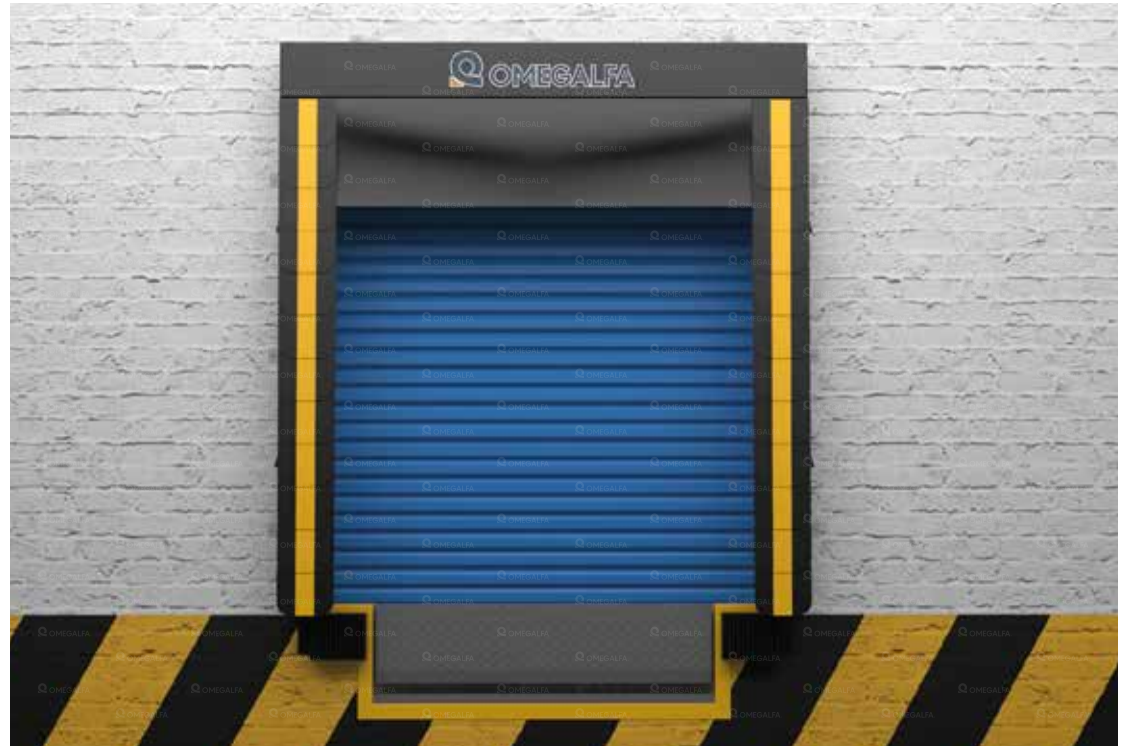
*Representación digital. Sello para andén Cabezal Fijo con Cortina.